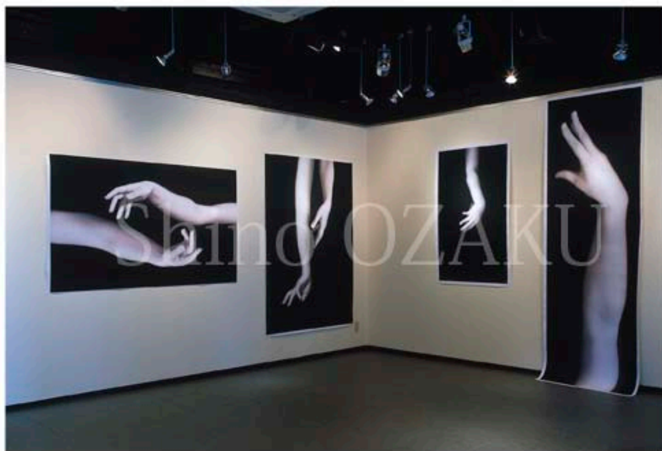
2005年「個展」<写真・手> ギャラリー・イン・ザ・ブルー（宇都宮）展示風景